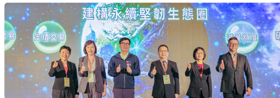
左起環境部施文真政務次長、國發會高仙桂副主委、高雄市陳其邁市長、碳交所林修銘董事長、金管會邱淑貞副主委、經濟部莊銘池主任秘書共同完成平台啟動儀式。

配合國家 2050 淨零排放政策，碳交所已分別於 2023 年 12 月及 2024 年 10 月推出國際碳權交易平台及國內減量額度交易平台，提供企業購買碳權之管道，未來，證交所及子公司將持續透過各項措施，活絡碳交易市場，以協助臺灣邁向淨零。